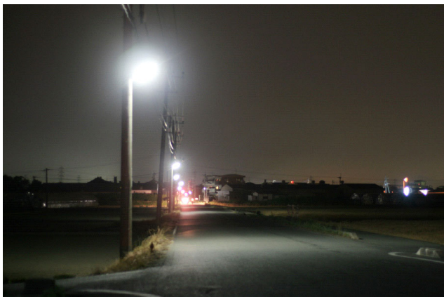
従来型は明るさの割にキラキラ感が強い